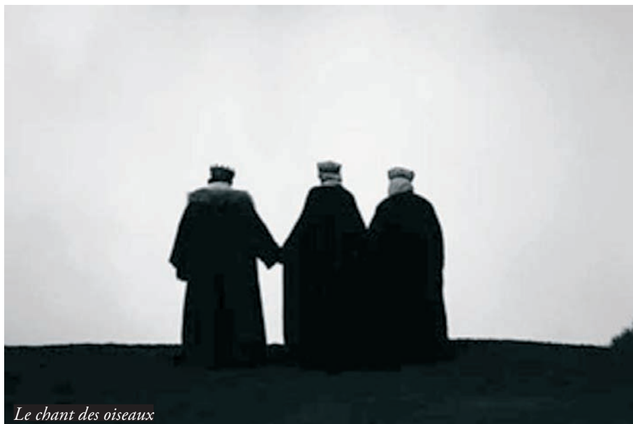
Le chant des oiseaux

En 2002, Laura Waddington a passé plusieurs mois dans les champs autour du camp de la Croix Rouge à Sangatte avec des réfugiés afghans et irakiens qui essayaient de traverser le tunnel sous la Manche pour rejoindre l'Angleterre. Filmé entièrement de nuit avec une petite caméra vidéo, Border est un témoignage personnel sur le sort des réfugiés et la violence policière qui a suivi la fermeture du camp.