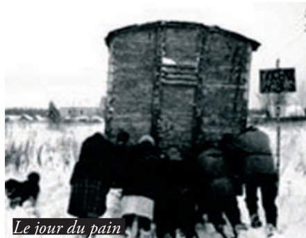
Le jour du pain