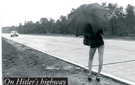
On Hitler's highway

La Californie ! État solaire aux sources de l'American Dream où chacun naïvement y voit les traces d'une réussite évidente. Lee Ann Schmitt va pourtant nous renvoyer très vite à une réalité moins utopique. La réalisatrice met en images les vestiges de ces villes industrielles devenues leurs propres fantômes. Il n'y a plus rien, les hommes sont partis ; seul le sable fuit dans les rues, les maisons sont totalement abandonnées, les hôtels vides, les lieux de détente tristes, les routes désertiques... Une inquiétante étrangeté règne dans ces nombreuses villes éphémères, aujourd'hui simples natures mortes d'une réalité économique et politique ayant subi les affres du libéralisme et de la privatisation. Ce voyage, accentué par un sens évident du cadre et une gestion du temps dans l'image, crée un basculement, un état de malaise de plus en plus profond. Les voyages sous le soleil californien sont-ils tous beaux ? Il semble que les longues lignes droites de l'État américain le plus puissant du pays cachent les vestiges d'une réalité plus contemporaine.