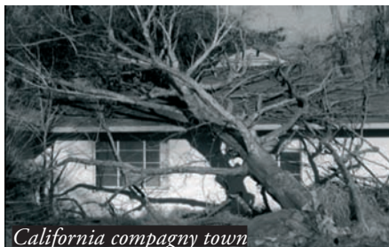
California company town