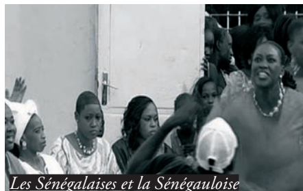
Les Sénégalaises et la Sénégalaise