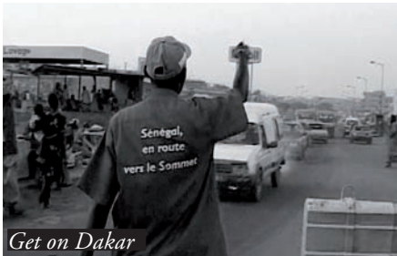
Get on Dakar