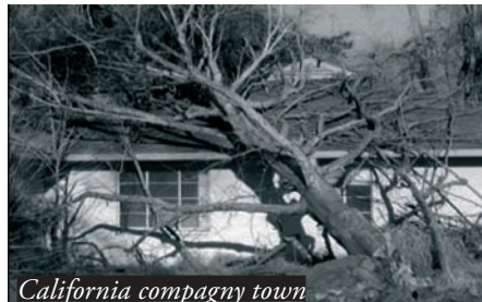
California compagny town