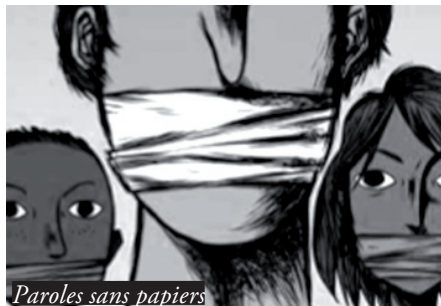
Paroles sans papiers