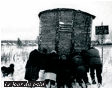
Le jour du pain