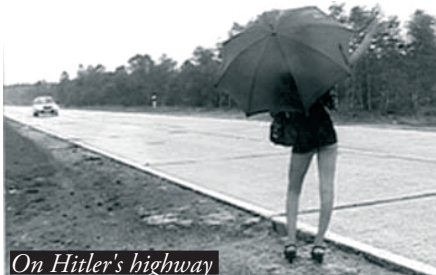
On Hitler's highway

La Californie ! État solaire aux sources de l'American Dream où chacun naïvement y voit les traces d'une réussite évidente. Lee Ann Schmitt va pourtant nous renvoyer très vite à une réalité moins utopique. La réalisatrice met en images les vestiges de ces villes industrielles devenues leurs propres fantômes. Il n'y a plus rien, les hommes sont partis ; seul le sable fuit dans les rues, les maisons sont totalement abandonnées, les hôtels vides, les lieux de détente tristes, les routes désertiques... Une inquiétante étrangeté règne dans ces nombreuses villes éphémères, aujourd'hui simples natures mortes d'une réalité économique et politique ayant subi les ares du libéralisme et de la privatisation. Ce voyage, accentué par un sens évident du cadre et une gestion du temps dans l'image, crée un basculement, un état de malaise de plus en plus profond. Les voyages sous le soleil californien sont-ils tous beaux ? Il semble que les longues lignes droites de l'État américain le plus puissant du pays cachent les vestiges d'une réalité plus contemporaine.