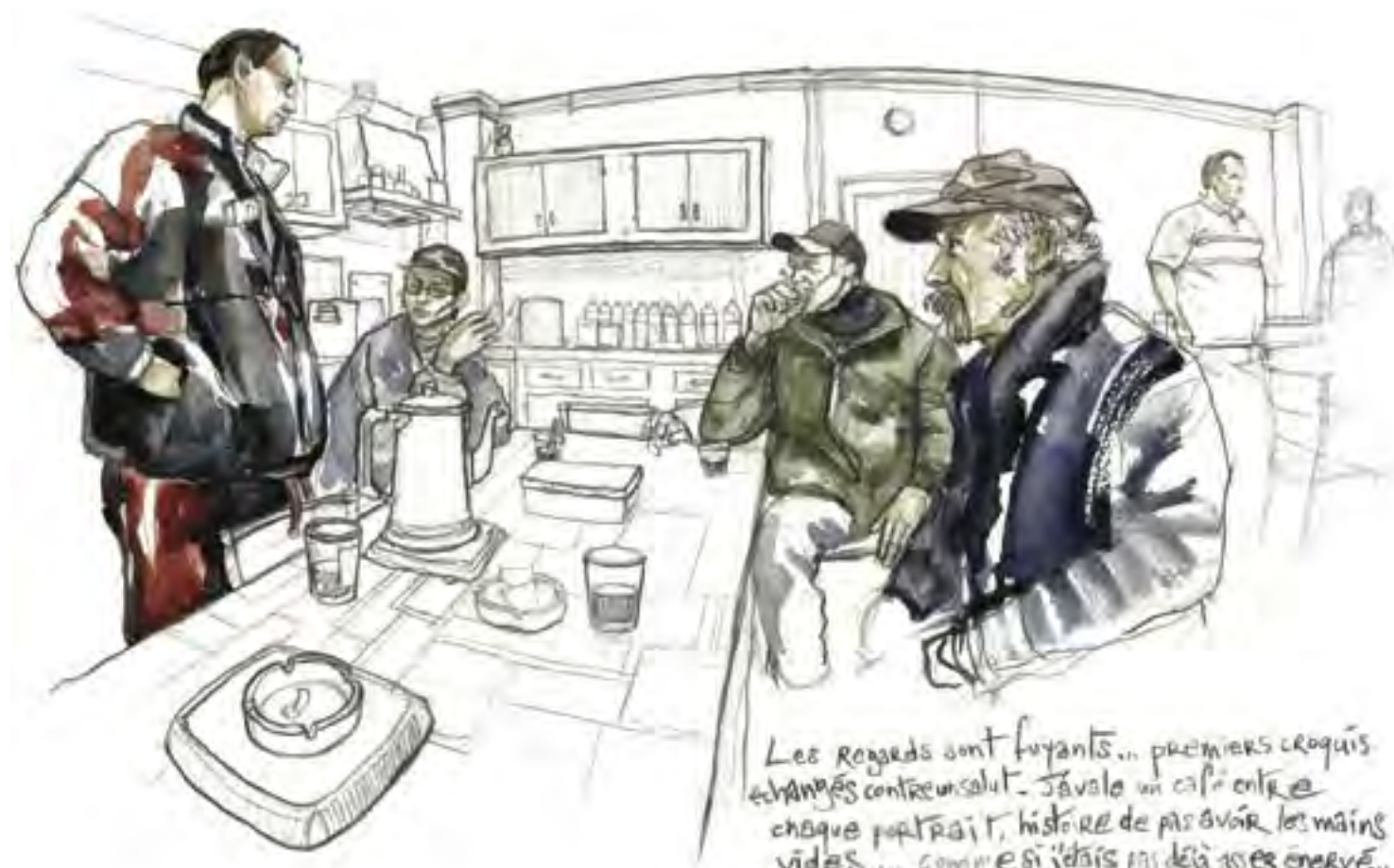
Les regards sont fuyants... premiers croquis échangés contre un salut. J'avale un café entre chaque portrait, histoire de pas avoir les mains vides... comme si j'déjà pas déjà assez énervé...

Les bénévoles se réunissent pour le café une heure après les Compagnons : première frontière entre les deux branches de la communauté, qui se côtoient sans vraiment se mélanger. Les trente compagnons prennent place autour de longues tables réunies en carré. On m'installe à la droite du chef. Place inconfortable du nouveau venu, de l'hôte forcément hostile. Exclu des reclus, je fais mine d'ignorer la gêne dans les silences et les coins dans les sourires.