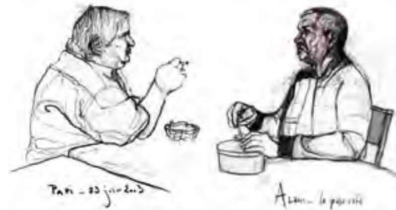
Paris - 23 juin 2003