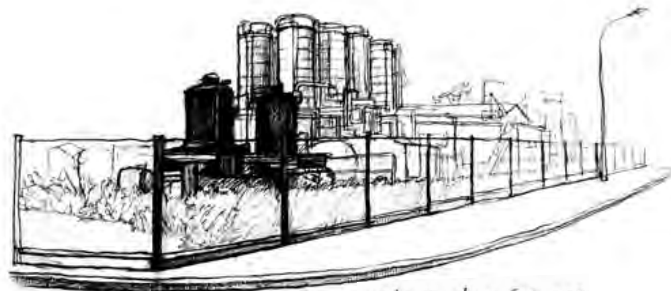
usine, Lucé, 9 mars