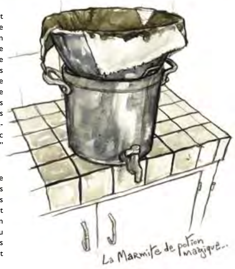
La Marmite de potion magique...

ix heures, pause-café, rituel scrupuleusement observé qui rythme la journée. Le breuvage magique est censé "donner du courage" en substituant ses vertus excitantes à la traître euphorie de l'alcool. Rictus de stupéfaction à l'ingestion de cette boisson d'hommes, dont l'âpre fumet se mêle aux effluves du boudin mijotant déjà pour le dîner. C'est pendant le filtrage, au cœur des fibres de torchons multi-usages, que le tord-boyaux maison puise son arôme inimitable. Si les Compagnons peuvent s'en enfile jusqu'à quatre marmites par jour, la plupart des bénévoles trouvent l'arabica-spécial-ferme "franchement dégueu". "Mais il est fait avec tellement de gentillesse qu'on ne peut pas le refuser" précise l'un d'eux en se servant discrètement un thé.