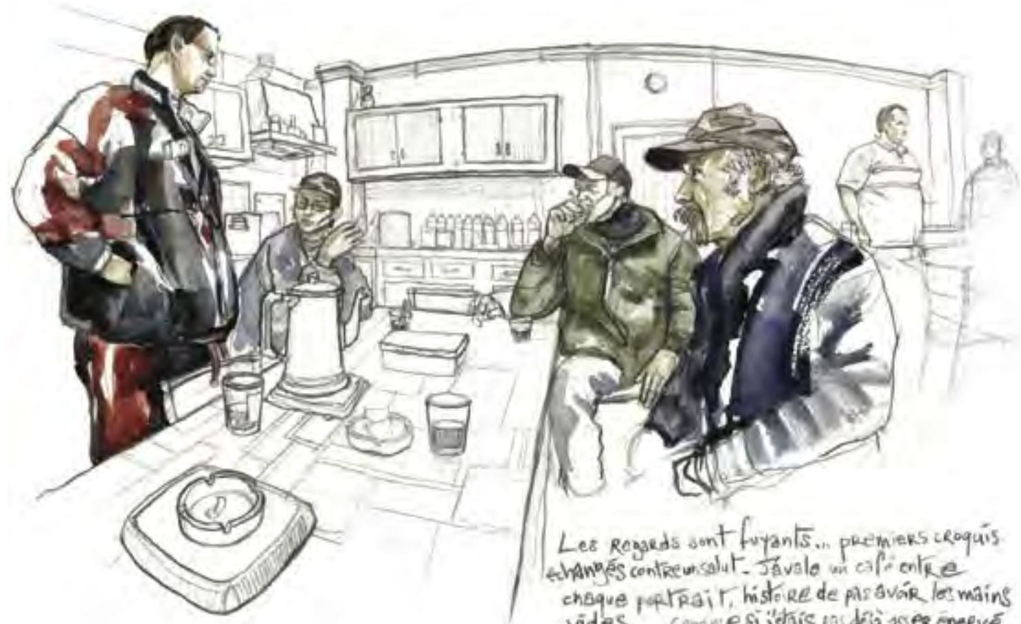
Les regards sont fuyants... premiers croquis échangés contre un salut. J'avale un café entre chaque portrait, histoire de pas avoir les mains vides... comme si j'déjà pas déjà assez énervé...

Les bénévoles se réunissent pour le café une heure après les Compagnons : première frontière entre les deux branches de la communauté, qui se côtoient sans vraiment se mélanger. Les trente compagnons prennent place autour de longues tables réunies en carré. On m'installe à la droite du chef. Place inconfortable du nouveau venu, de l'hôte forcément hostile. Exclu des reclus, je fais mine d'ignorer la gêne dans les silences et les coins dans les sourires.