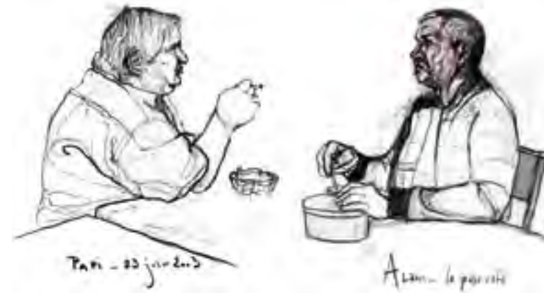
Paris - 23 juin 2003