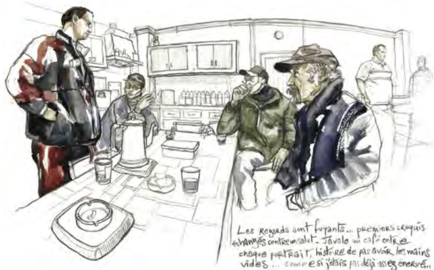
Les regards sont fuyants... premiers croquis échangés contre un salut. J'avale un café entre chaque portrait, histoire de pas avoir les mains vides... comme si j'déjà pas déjà assez énervé...

Les bénévoles se réunissent pour le café une heure après les Compagnons : première frontière entre les deux branches de la communauté, qui se côtoient sans vraiment se mélanger. Les trente compagnons prennent place autour de longues tables réunies en carré. On m'installe à la droite du chef. Place inconfortable du nouveau venu, de l'hôte forcément hostile. Exclu des reclus, je fais mine d'ignorer la gêne dans les silences et les coins dans les sourires.