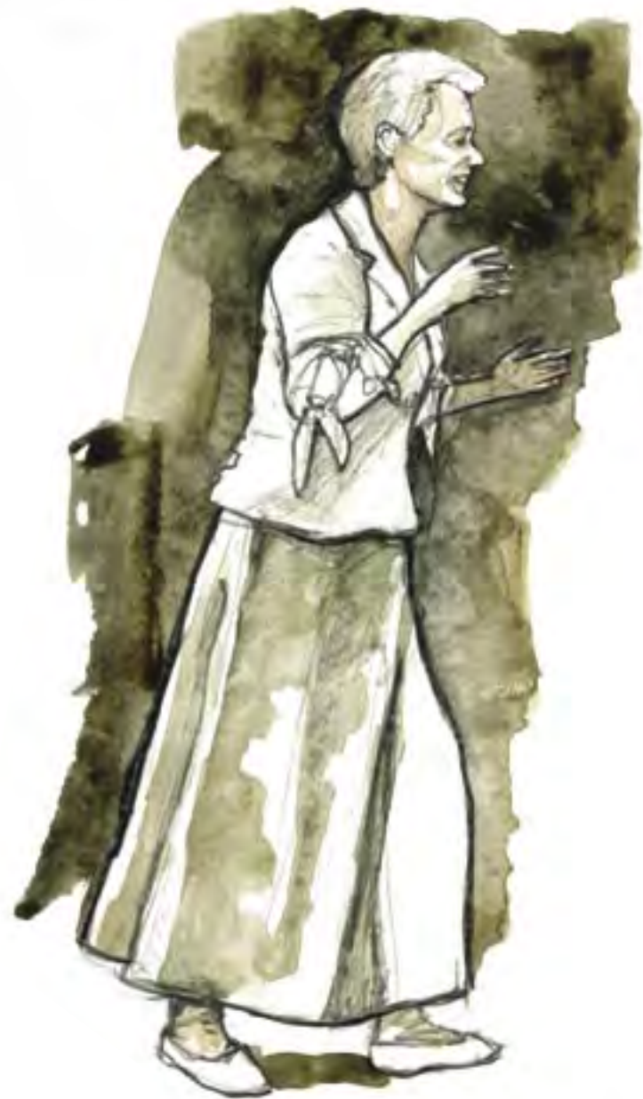
la tornade blanche...

Les hommes se bousculent au portillon, pour ne pas passer à côté de la parole rare, assurément sifflée sous les débanas. Un Compagnon les surveille de loin: "On devrait se recaler, parce que quand on ouvre, ils déboulent comme des fous, une vraie ruée vers l'or!"