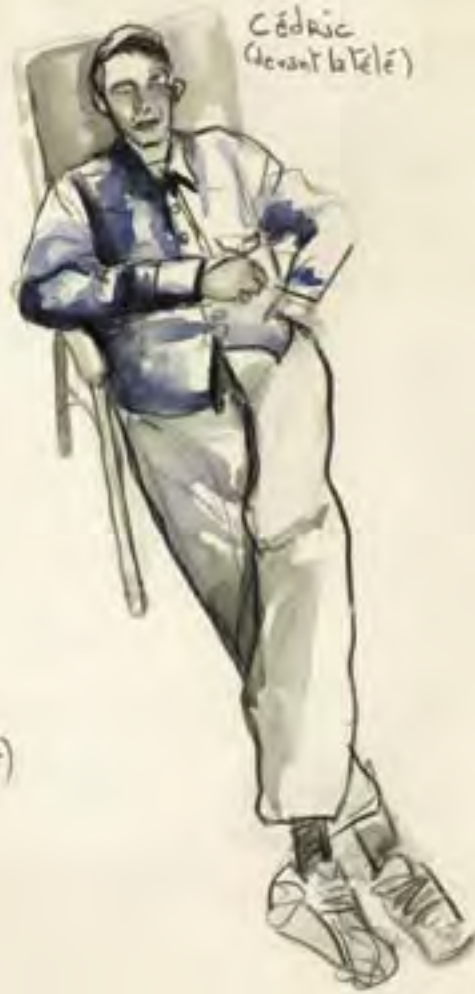
Cédric (devant la télé)