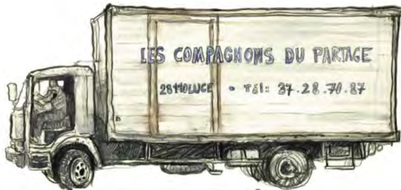
Les gros camions des grands chefs...

Comme chacune des communautés d'Emmaüs, celle des Compagnons du Partage réactualiserait ainsi, en lui donnant corps, la rencontre originaria de Jésus avec la Samaritaine, ou de l'abbé Pierre, le bourgeois rebelle, avec Georges, le criminel suicidaire. De cette rencontre naît le lien qui permet de bousculer et de dépasser le cloisonnement premier entre l'amour et l'amer.