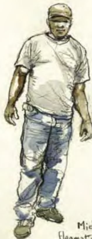
Michel flegmatique, mais prêt à dégainer!

Ce qui frappe d'abord chez Michel, c'est la douceur mélancolique de son sourire. Cent kilos de masse musculaire finissent ensuite de désarmer les détracteurs les plus féroces -