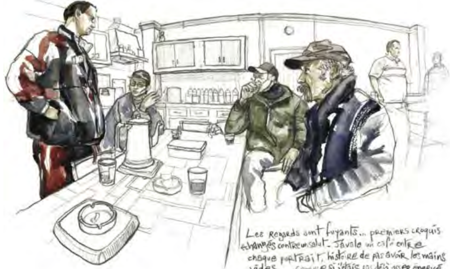
Les regards sont fuyants... premiers croquis échangés contre un salut. J'avale un café entre chaque portrait, histoire de pas avoir les mains vides... comme si j'déjà pas déjà assez énervé...

Les bénévoles se réunissent pour le café une heure après les Compagnons : première frontière entre les deux branches de la communauté, qui se côtoient sans vraiment se mélanger. Les trente compagnons prennent place autour de longues tables réunies en carré. On m'installe à la droite du chef. Place inconfortable du nouveau venu, de l'hôte forcément hostile. Exclu des reclus, je fais mine d'ignorer la gêne dans les silences et les coins dans les sourires.