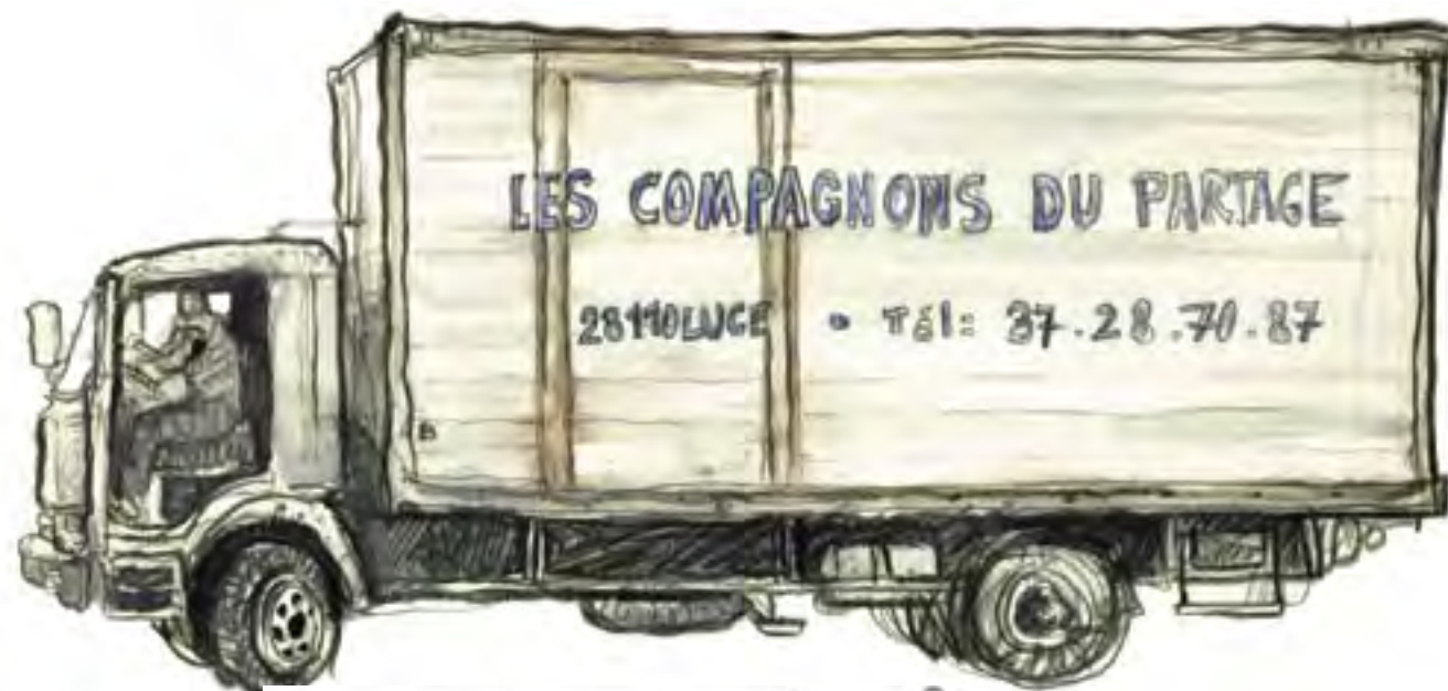
Les gros camions des grands chefs...

Comme chacune des communautés d'Emmaüs, celle des Compagnons du Partage réactualiserait ainsi, en lui donnant corps, la rencontre originaria de Jésus avec la Samaritaine, ou de l'abbé Pierre, le bourgeois rebelle, avec Georges, le criminel suicidaire. De cette rencontre naît le lien qui permet de bousculer et de dépasser le cloisonnement premier entre l'amour et l'amer.