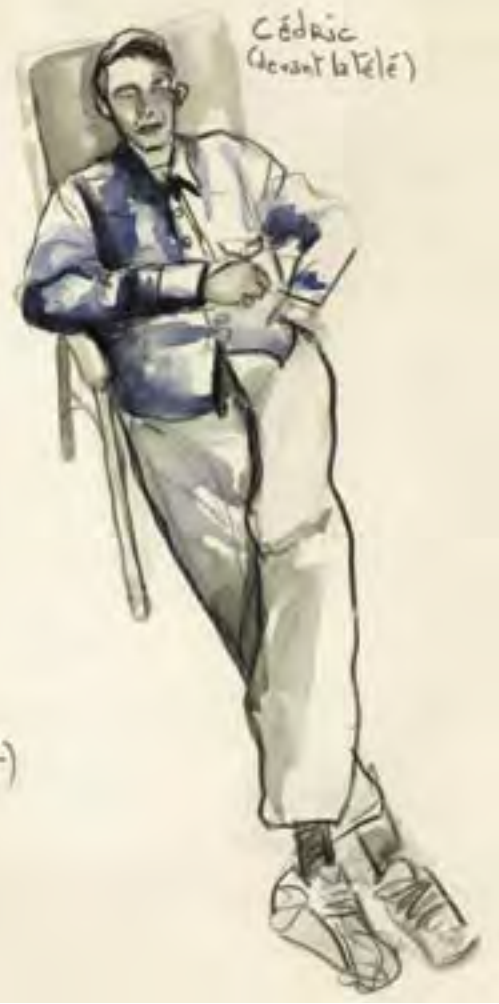
Cédric (devant la télé)