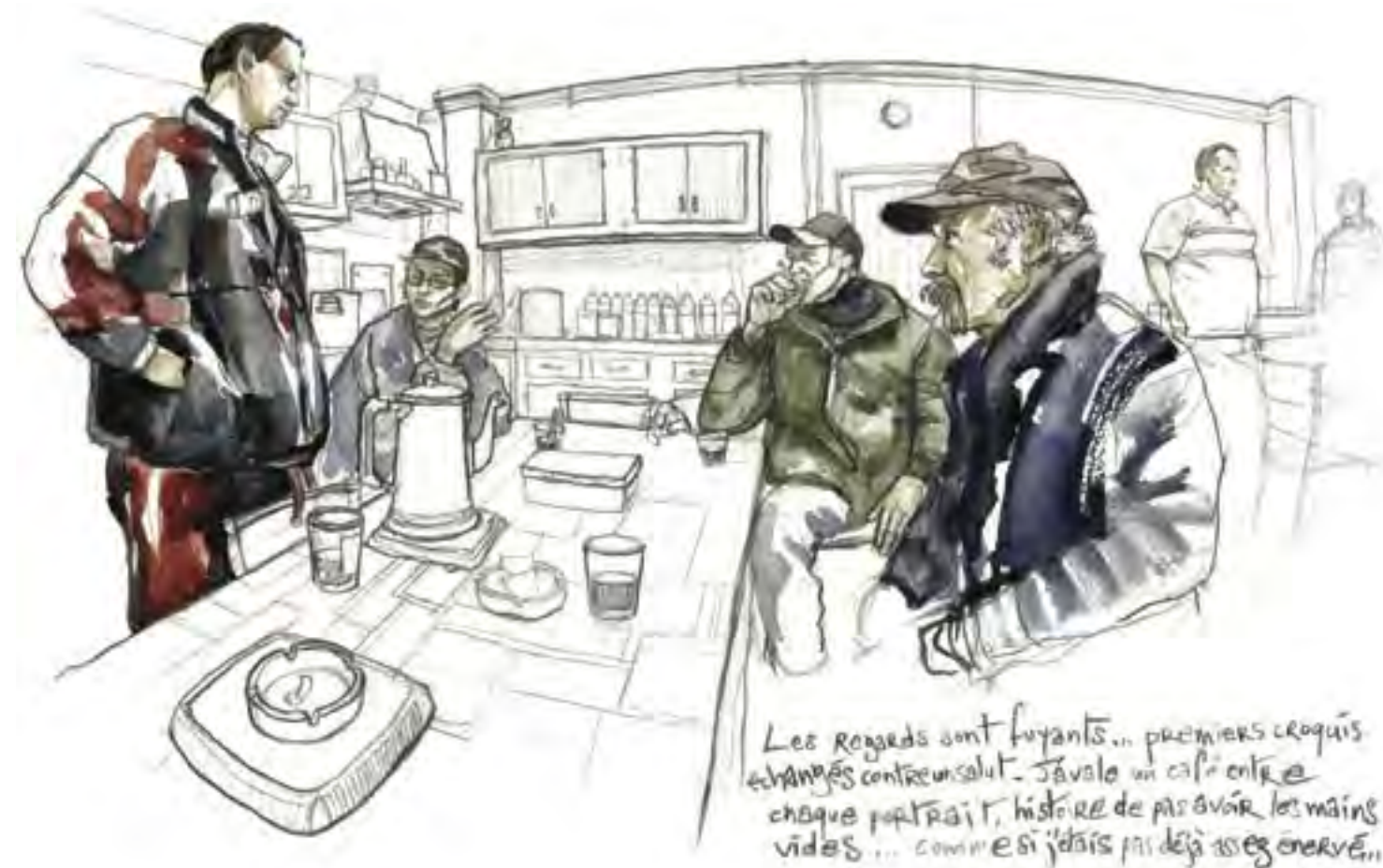
Les regards sont fuyants... premiers croquis échangés contre un salut. J'avale un café entre chaque portrait, histoire de pas avoir les mains vides... comme si j'déjà pas déjà assez énervé...

Les bénévoles se réunissent pour le café une heure après les Compagnons : première frontière entre les deux branches de la communauté, qui se côtoient sans vraiment se mélanger. Les trente compagnons prennent place autour de longues tables réunies en carré. On m'installe à la droite du chef. Place inconfortable du nouveau venu, de l'hôte forcément hostile. Exclu des reclus, je fais mine d'ignorer la gêne dans les silences et les coins dans les sourires.