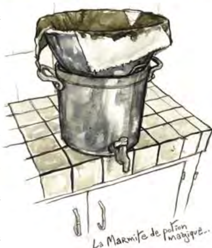
La Marmite de potion magique...

Dix heures, pause-café, rituel scrupuleusement observé qui rythme la journée. Le breuvage magique est censé "donner du courage" en substituant ses vertus excitantes à la traître euphorie de l'alcool. Rictus de stupéfaction à l'ingestion de cette boisson d'hommes, dont l'âpre fumet se mêle aux effluves du boudin mijotant déjà pour le dîner. C'est pendant le filtrage, au cœur des fibres de torchons multi-usages, que le tord-boyaux maison puise son arôme inimitable. Si les Compagnons peuvent s'en enfileur jusqu'à quatre marmites par jour, la plupart des bénévoles trouvent l'arabica-spécial-ferme "franchement dégueu". "Mais il est fait avec tellement de gentillesse qu'on ne peut pas le refuser" précise l'un d'eux en se servant discrètement un thé.