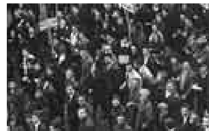
Sochaux 11 juin 68

« Un quartier de Bogota s'organise, soutenu par le PC colombien. Le vendredi saint 1966 de nouveaux habitants arrivent en portant à dos d'hommes leurs pauvres maisons en papier goudronné. L'armée intervient et détruit ces symboles. Les habitants se défendent. Il y a des morts et des blessés. » (B. M.)