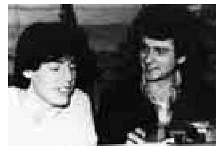
Lionel Soukaz & Guy Hocquenghem