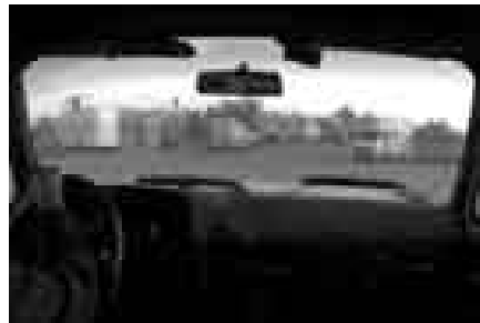
Below sea level