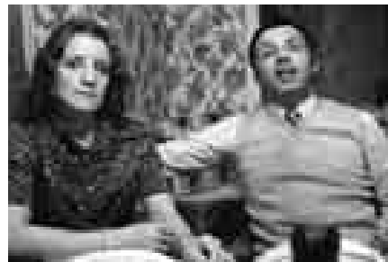
A pas lentes