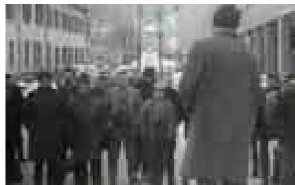
A bientôt j'espère