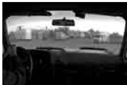
Below sea level