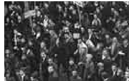
Sochaux 11 juin 68

« Un quartier de Bogota s'organise, soutenu par le PC colombien. Le vendredi saint 1966 de nouveaux habitants arrivent en portant à dos d'hommes leurs pauvres maisons en papier goudronné. L'armée intervient et détruit ces symboles. Les habitants se défendent. Il y a des morts et des blessés. » (B. M.)