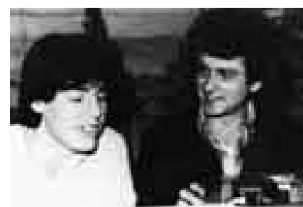
Lionel Soukaz & Guy Hocquenghem