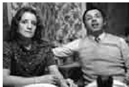
A pas lentes