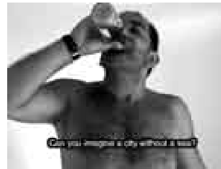
The sea is a stereo