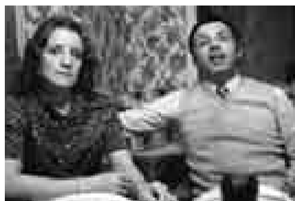
A pas lentes