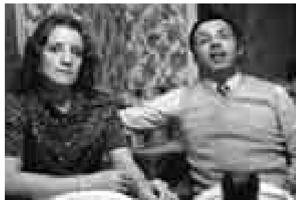
A pas lentes