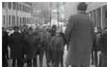
A bientôt j'espère